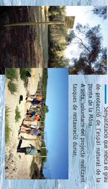
Senyalització que indica el grau de protecció de l'espai natural de la punta de la Móra. A sota, voluntaris del projecte realitzant tasques de restauració dunar.

En l'actualitat, les principals activitats humanes que es realitzen a l'espai són l'agricultura i l'oci. La primera aprofita la terra fèrtil per plantar-hi els seus conreus. L'oci és una activitat en creixement a la punta de la Móra que s'intensifica especialment els mesos d'estiu: els ciutadans de la ciutat i els visitants aprofiten aquest espai per fer passejades, per fer esport, per anar a la platja, per realitzar activitats aquàtiques... una sèrie d'activitats que es poden dur a terme si no es malmeten els valors de l'espai, és a dir, buscant sempre l'equilibri entre l'ús de la punta de la Móra i la seva conservació.