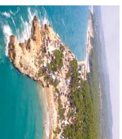
Punta de la Móra