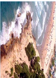
Punta de la Creueta

Us suggerim un recorregut per a descobrir la punta de la Móra amb diversos llocs d'interès; feu-lo tot passejant. Comenceu a la punta de la Creueta , al final de la platja Llarg, una pedrera romana de la que s'extreia la pedra per edificar alguns dels monuments de Tarragona. En aquest punt és fàcil observar tot un seguit de fòssils, que són els mateixos que es troben al Medol o als penya-segats de la punta de la Móra. Abans d'arribar a la cala Fonda