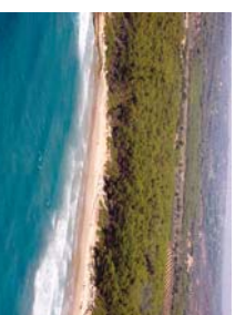
Platja de la Roca Plana